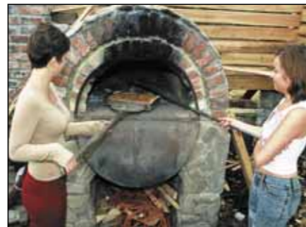
Skansen v osadě Pstrážna