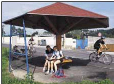
V Bělóvsi vede trasa podle fotbalového stadionu