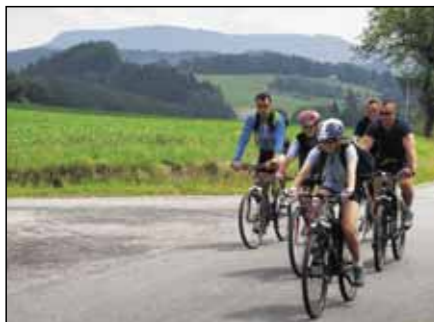
Cesta vedoucí do Žďárek se stolovou horou Bor v pozadí