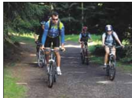
Do Jakubowic vede trasa po lesní cestě