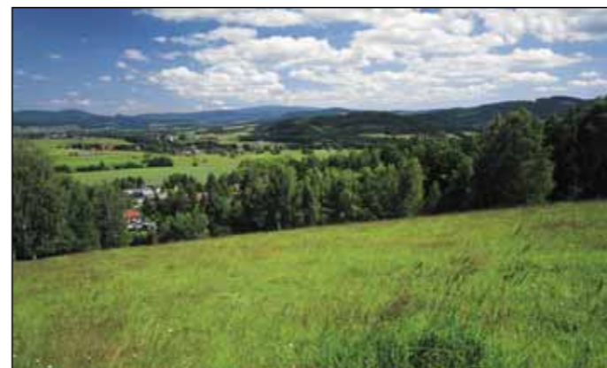
Malebná krajina českopolského pohraničí, kterou vede okruh T. G. Masaryka

Rok 1903: Ve Velkém Dřevčíně u Hronova trávil dovolenou se svou rodinou Tomáš Garrigue Masaryk, profesor a budoucí 1. československý prezident. Rád cestoval, podnikal pěší výlety, jezdil na kole. Při svém pobytu na Hronovsku navštívil se svými blízkými také „český koutek“ v tehdejší Prusku - vesničky na svazích majestátného Boru. Je snad symbolické, že místa, která tehdy navštívil, se stávají v roce vstupu České a Polské republiky do EU, u příležitosti 650 respektive 750 let od první písemné zmínky o Kudově Zdroji a Náchodu, cílem přátel z obou stran donedávna téměř neprostopupné státní hranice. Osobou demokrata a Evropana T. G. Masaryka si tak připomínáme, že pomyslná čára dělící národy nepatří do Evropy. Chceme společně přispět k tomu, že jednou zmizí zcela a stane se nenávratně minulostí.