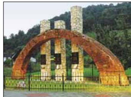
Okruh T. G. M. vede v Czerme kolem památníku tří kultur