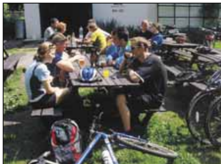
Možnost občerstvení poskytují pohostinství Doly